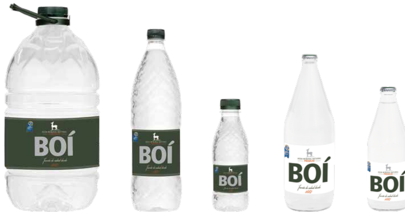
GARRAFA PET 5 L

El agua de Caldes de Boí fue declarada de utilidad pública el 20 de diciembre de 1887 y emerge de forma natural a una temperatura de 32°. Es un agua de mineralización débil con 105 mg/l de residuo en seco. Gracias a su bajo contenido en calcio evitamos la formación de cálculos y cristales únicos en el riñón, así mismo el manantial tiene un alto contenido en sílice facilitando la eliminación de las acumulaciones de las grasas y los residuos de nuestro organismo.