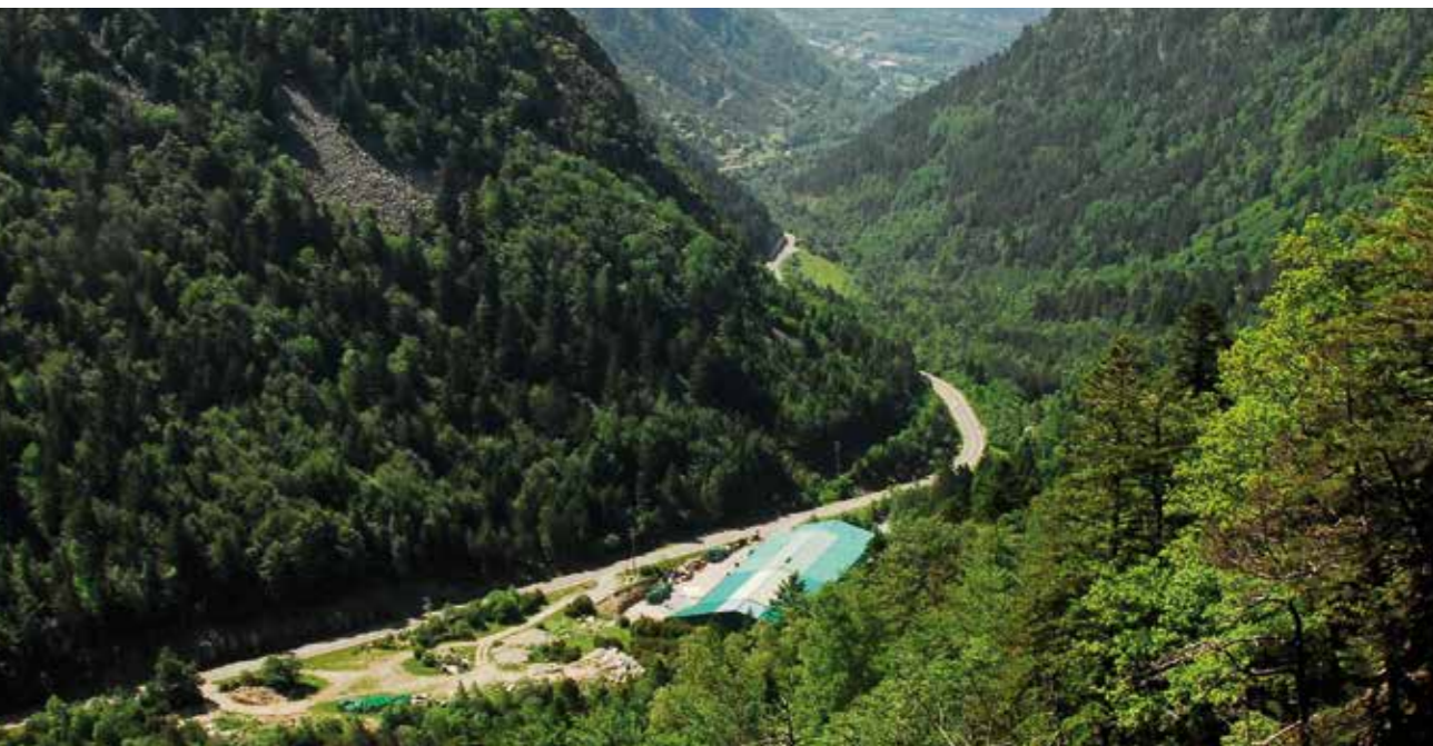
Planta / Planta embotelladora