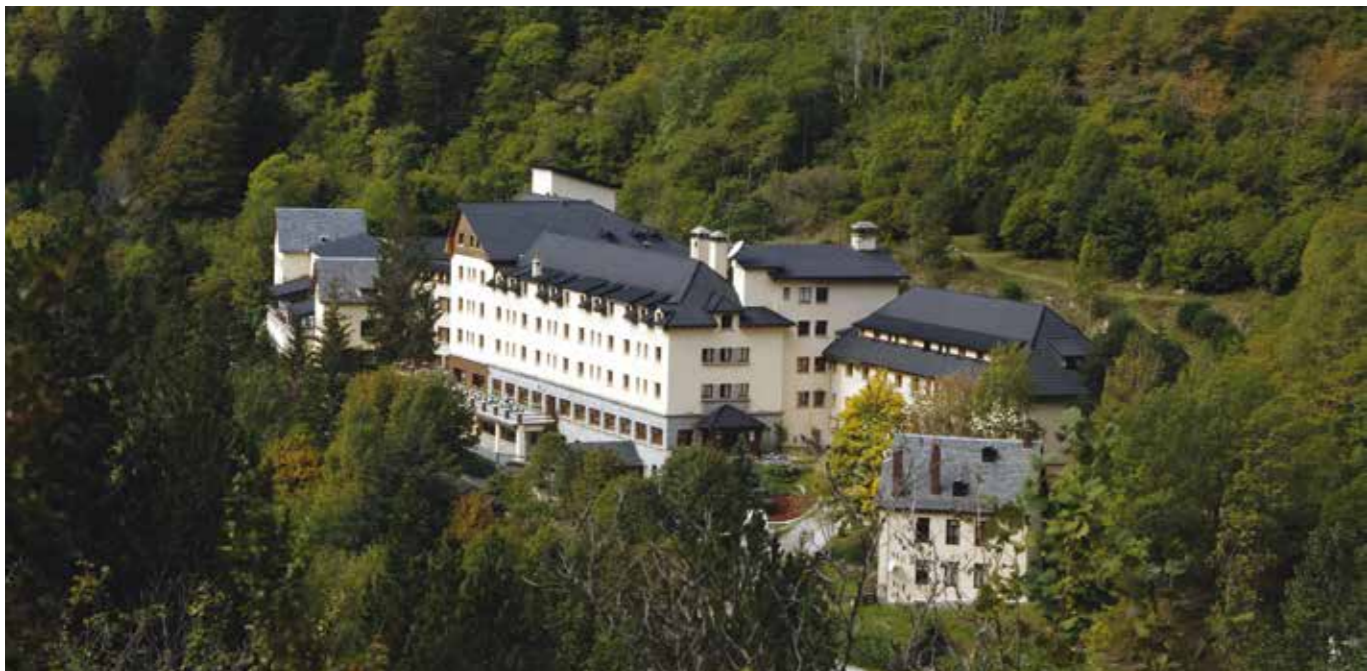
Balneari / Balneario de Caldes de Boí