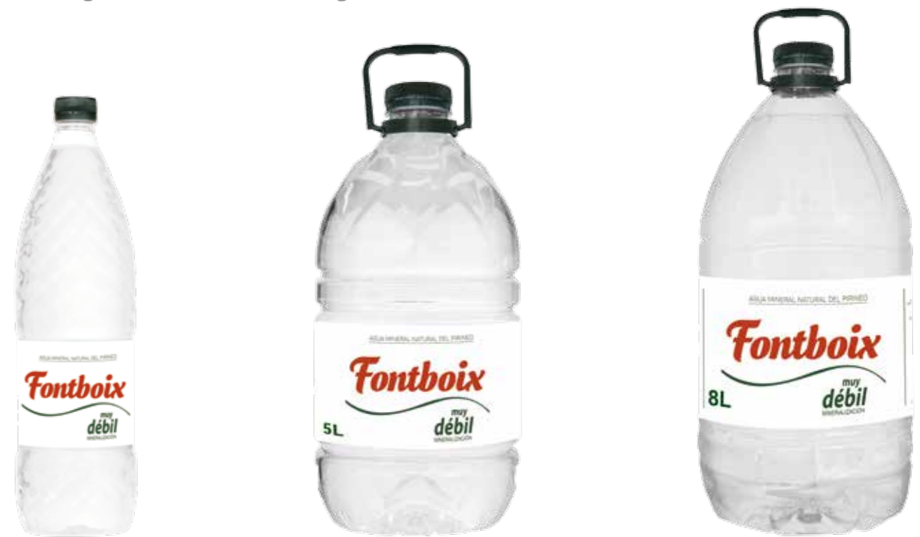
AMPOLLA BOTELLA 1,5 L

Fontboix es un agua mineral natural de mineralización muy débil con tan solo 40 mg/l de residuo en seco y emerge de forma natural a una temperatura de 7°. Por su composición es un agua que está especialmente indicada para las dietas pobres en sodio así como para la preparación de alimentos infantiles. Su especial ubicación y su excelente composición le confieren un sabor suave y agradable, es sin lugar a dudas un auténtico regalo de la naturaleza.